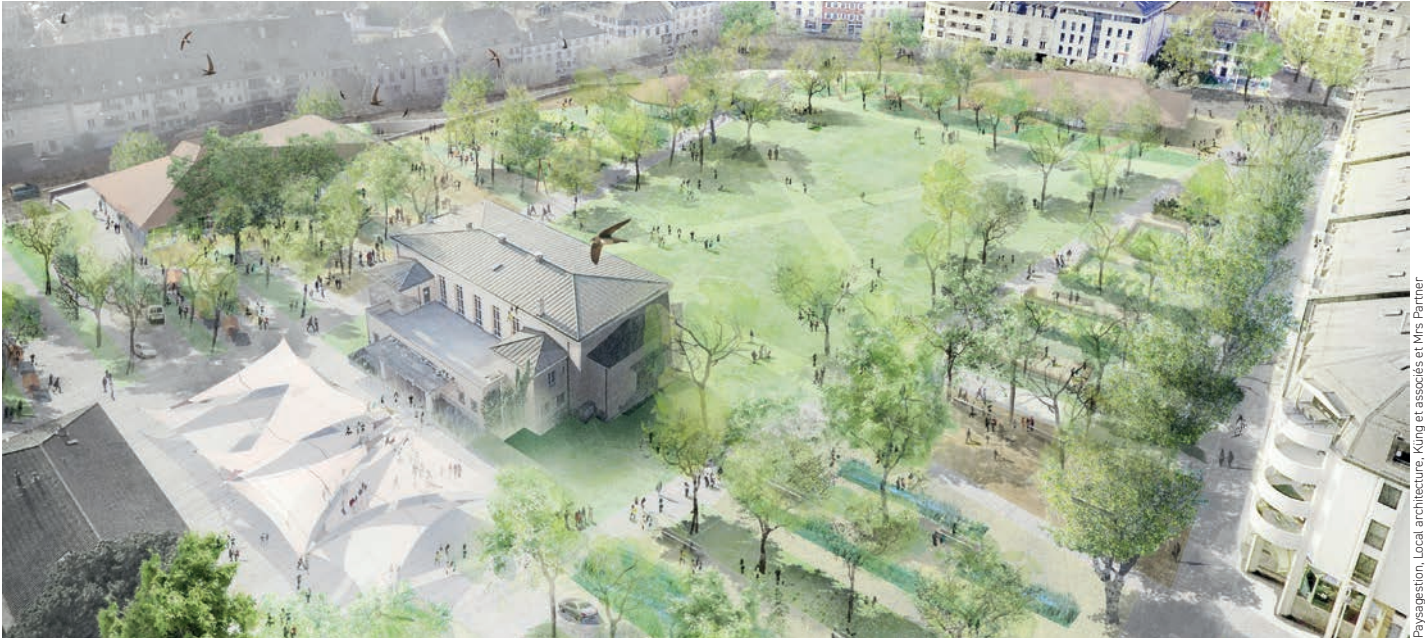
Paysagegestion, Local architecture, King et associés et Mrs Partner