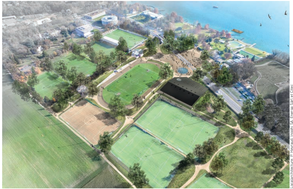
Localarchitecture, P. Heyraud, Inghit SA, Energie Sàrl et Citec

En janvier, la présentation du projet des futurs complexe multisport et parc des sports de Colovray a soulevé l'enthousiasme de la population comme des associations sportives. En déposant fin avril déjà une première demande de crédit d'étude au Conseil communal, la Municipalité a démontré sa volonté de répondre rapidement aux fortes attentes que suscite ce projet d'envergure. En décembre, le crédit a été accepté par le délibérant.